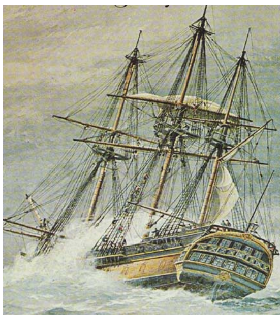
Fregatten Finland, ostindiefarare som inte är byggd vid Terra Nova. Efter omslag t Frängsmyr.

Mot slutet av 1700-talet minskade nybyggnationen av handelsfartyg vid Stockholmsvarven. Ett av skälen var att Ostindiska Kompaniet från fjärde oktroyen och framåt inte längre hade behov av någon omfattande nyproduktion, ett annat att produktionen vid andra varv inom det svenska väldet ökade kraftigt, både längs norrlandskusten, i Finland och i de svenska besittningarna söder om Östersjön. 7